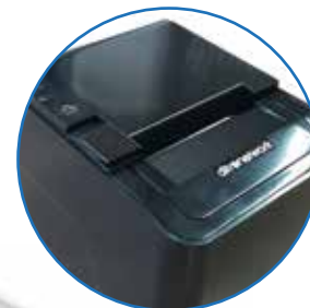
Disponibile anche in versione black