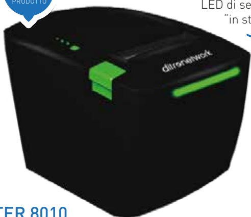
LED di segnalazione "in stampa"